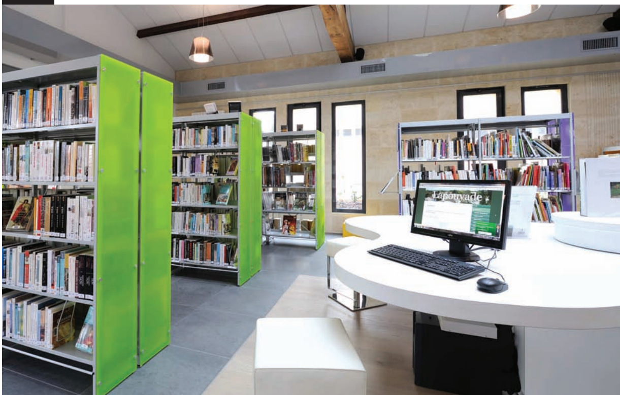
Bibliothèque «Espace Gérard Denoël» Parement en méthacrylate teinté kiwi. "Espace Gérard Denoël" library, Kiwi tinted methacrylate siding.