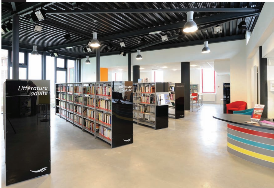
Médiathèque «Le Grand Lieu», La Chevrolière 44118, France. Parements en verre avec films et motifs découpés. "Le Grand Lieu » media library, La Chevrolière 44118, France. Glass sidings with cut out films and designs.