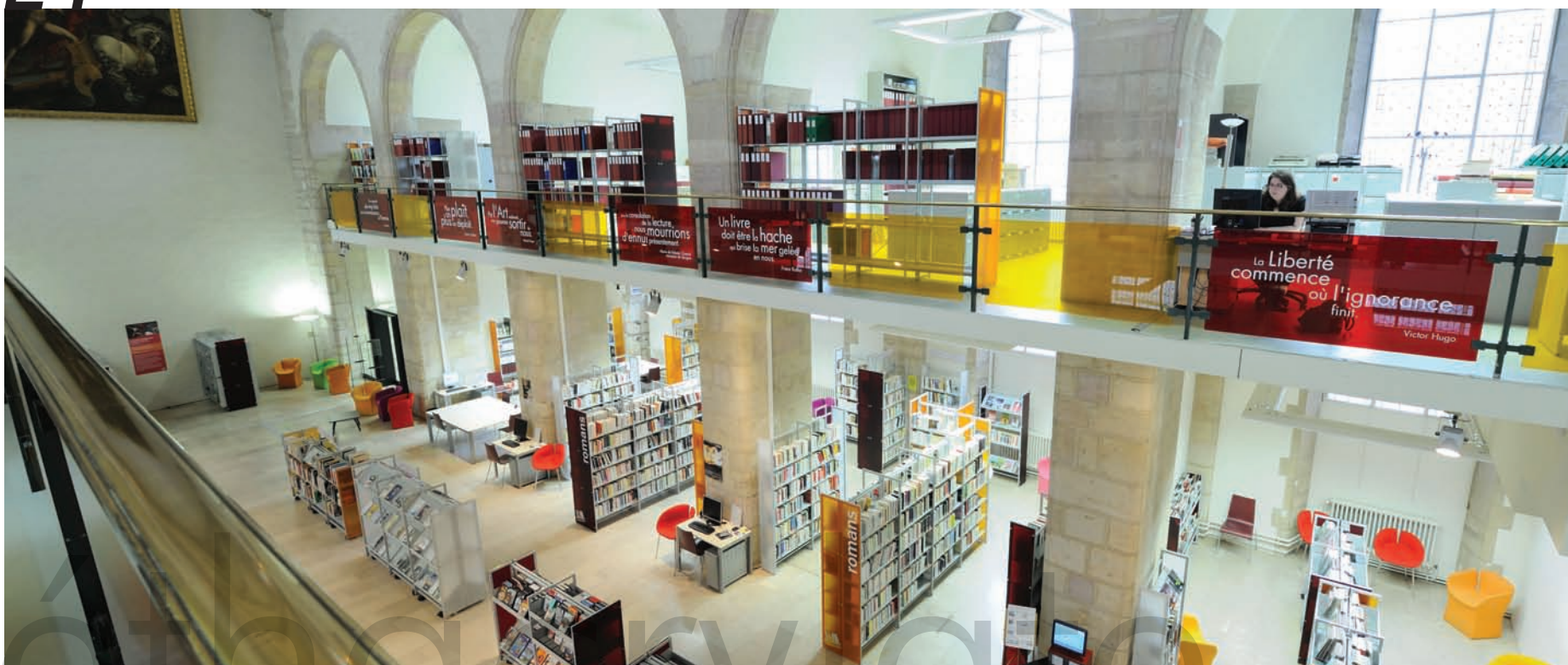
Bibliothèque La Nef de Dijon 21000. Parements en méthacrylate teintés avec textes et logos découpés. La Nef Library, Dijon 21000. Tinted methacrylate siding with cut out logos.