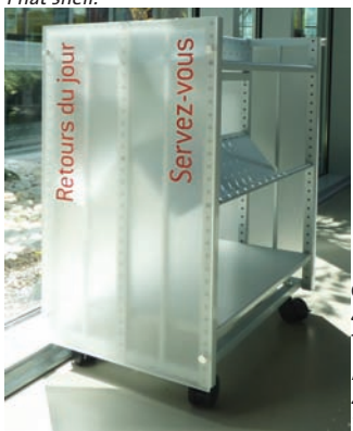
Chariot métallique 4 tablettes inclinées, 1 tablette plane. Metal truck fitted with 4 slanted shelves 1 flat shelf.