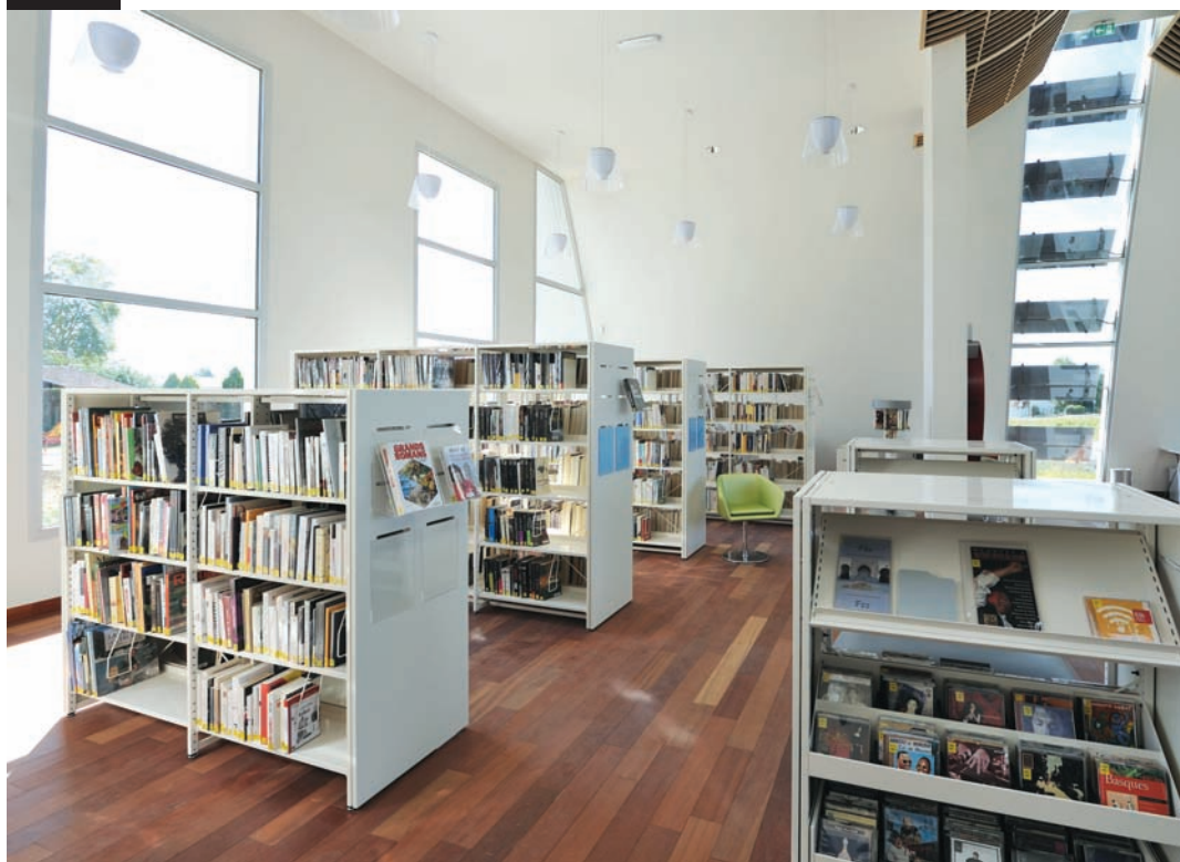
Bibliothèque municipale Le Passage D'Agen 47520. Parements en bois médium laqué blanc avec rainures. Municipal library, Le Passage D'Agen 47520. Lacquered medium white wood sidings with grooves.