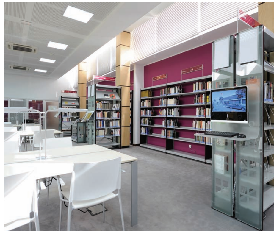
Médiathèque de la Fondation Mohammed VI, Rabat Maroc. Parements en verre avec dessins décor carrés. Mohammed VI Foundation Media Library, Rabat, Morocco. Glass sidings with square decorative art work.