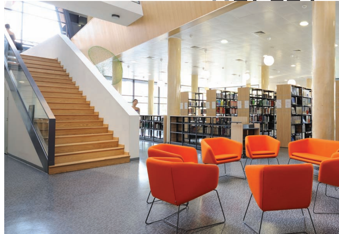
Bibliothèque Universitaire St Jean d'Angely de Nice Sophia Antipolis 06357. Parements en bois rainuré, finition chêne. St Jean d'Angely de Nice university library, Sophia Antipolis 06357. Grooved wood sidings, oak finish.