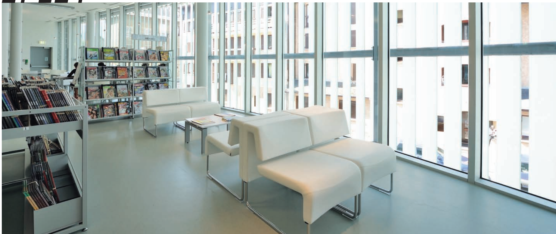
Médiathèque de Saint Jean de Maurienne 73300. Rayonnage Reflet avec parements en verre dépoli. Saint Jean de Maurienne media library, 73300. Reflet shelving with fine hackle glass sidings.