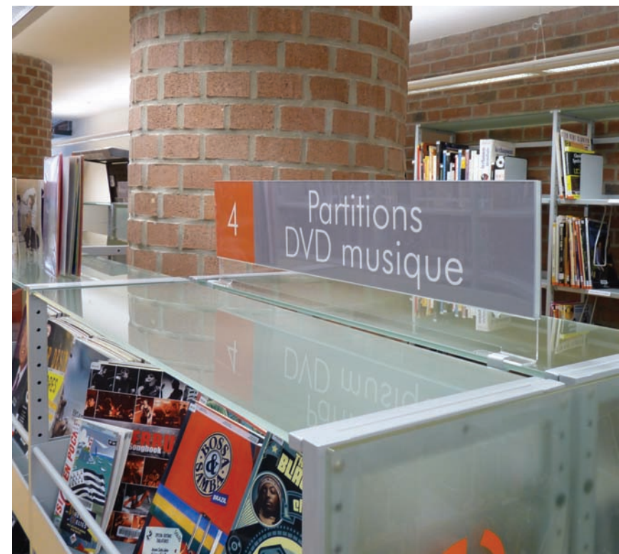
Médiathèque Till L'espègle de Villeneuve d'Ascq 59491. Tablettes chapeau en verre dépoli avec signalétique haute en plexi. Till L'espègle media library, Villeneuve d'Ascq 59491. Top shelves featuring fine hackle glass with high Plexiglas signage.