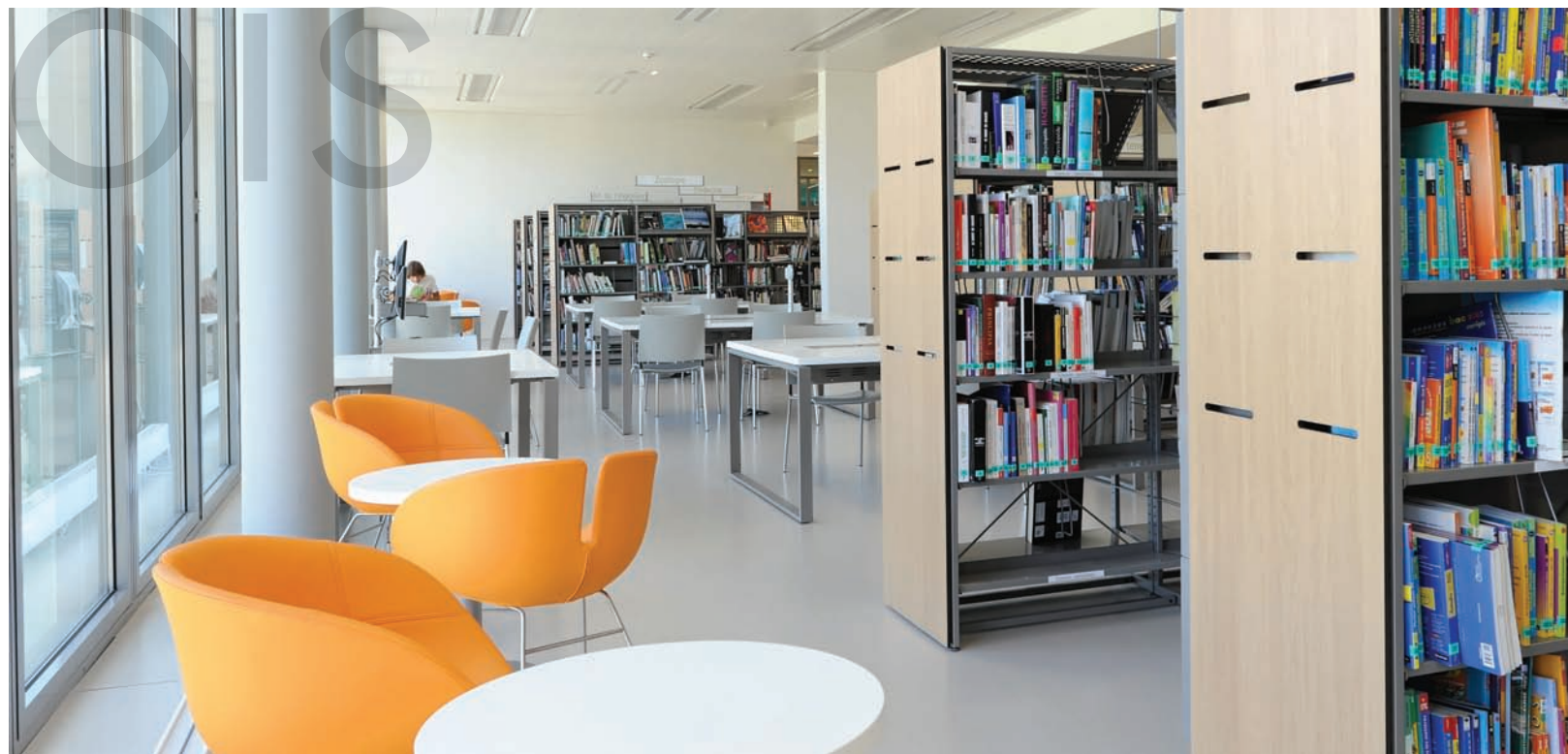
Médiathèque André Malraux Béziers 34500. Parements en compact finition chêne rainuré. André Malraux media library, Béziers 34500. Compacts sidings with grooved oak finish.