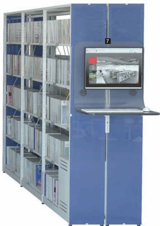
7 Poste OPAC de consultation ergonomique méthacrylate/ User friendly méthacrylate OPAC work station