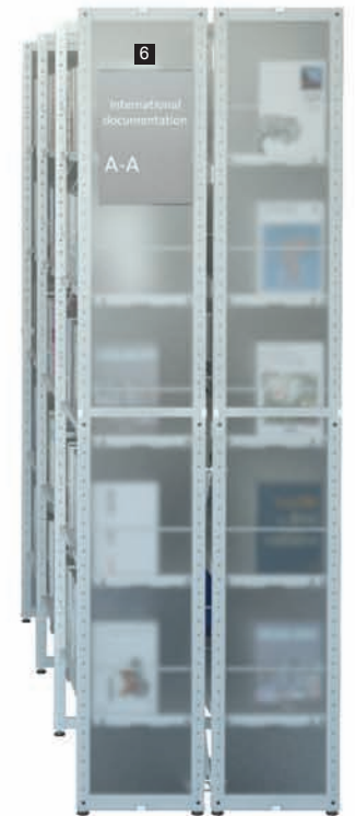
6 Signalétique latérale plexi/ Laterale signage