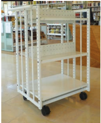
Chariot métallique 4 tablettes inclinées, 1 tablette plane. Metal truck fitted with 4 slanted shelves 1 flat shelf.