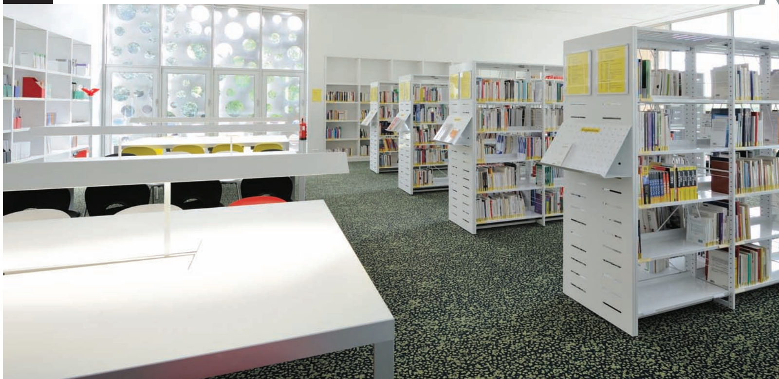
Bibliothèque Universitaire de l'IUT département GEA de Rennes. Parements en métal rainuré, peinture époxy. Rennes IUT university library, administrative and management department. Grooved metal sidings, epoxy paint.