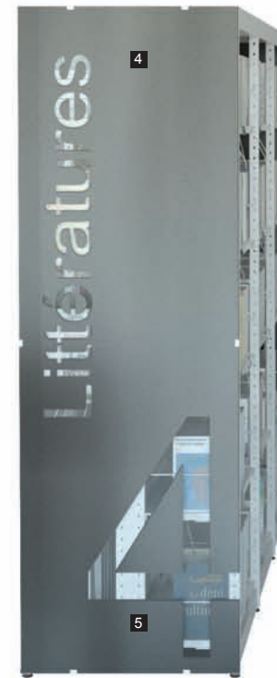
4 Signalétique film découpé/ Adhesive film signage