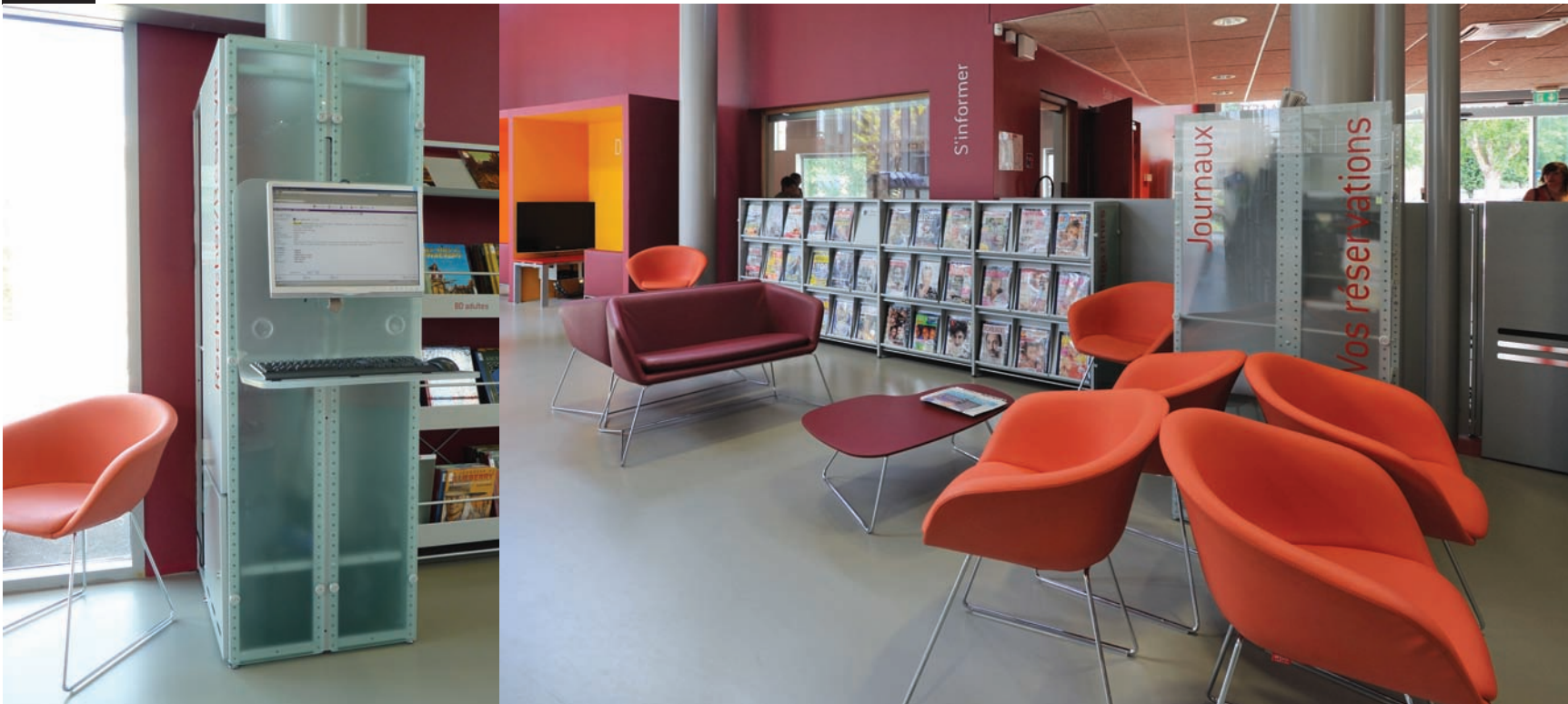
Pôle presse de la médiathèque Aimé Césaire de Bourg en Bresse. Press center of the Aimé Césaire media library in Bourg-en-Bresse.