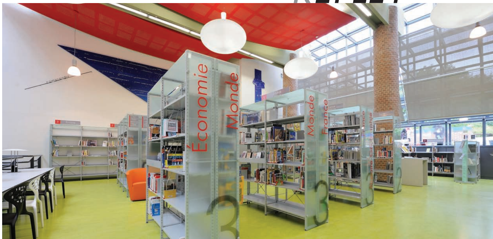
Médiathèque Till L'espègle de Villeneuve d'Ascq 59491. Parements et tablettes chapeau en verre dépoli. Till L'espègle media library, Villeneuve d'Ascq 59491. Top shelves featuring fine hackle glass with high Plexiglas signage.