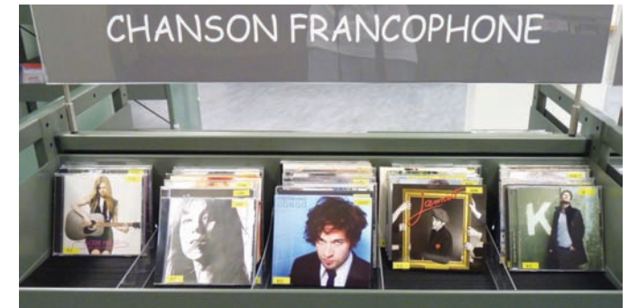
Bac audio pour adultes, cuves CD-DVD grande capacité séparateurs en plexi.