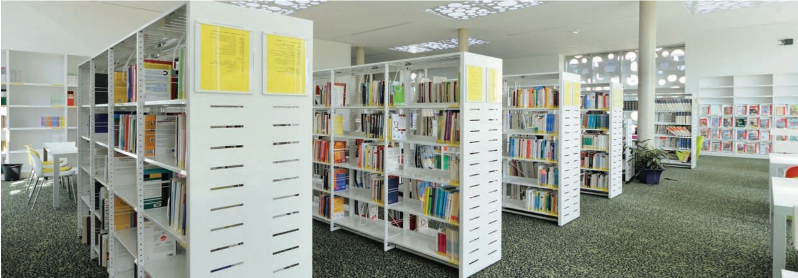
Bibliothèque Universitaire de l'IUT département GEA de Rennes, France. Parements en métal rainuré, peinture époxy blanc. Rennes IUT university library, administrative and management department, France. Grooved metal sidings, epoxy paint. white.