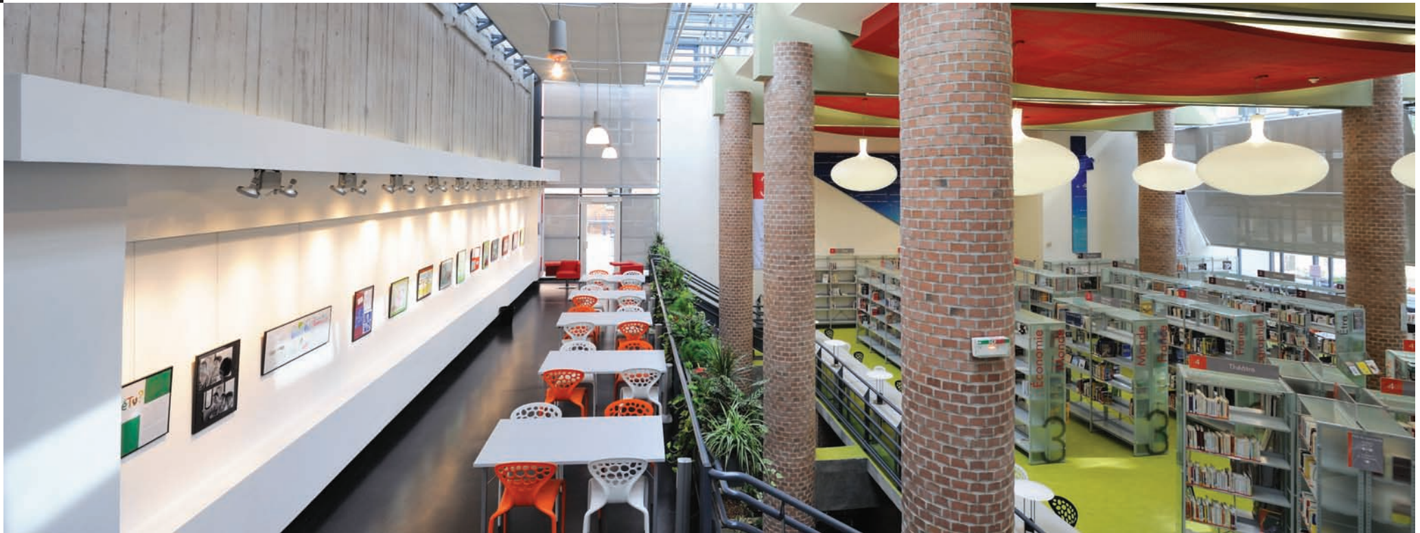
Médiathèque Till L'espègle de Villeneuve D'Ascq 59491. Till L'espègle media library, Villeneuve d'Ascq 59491.