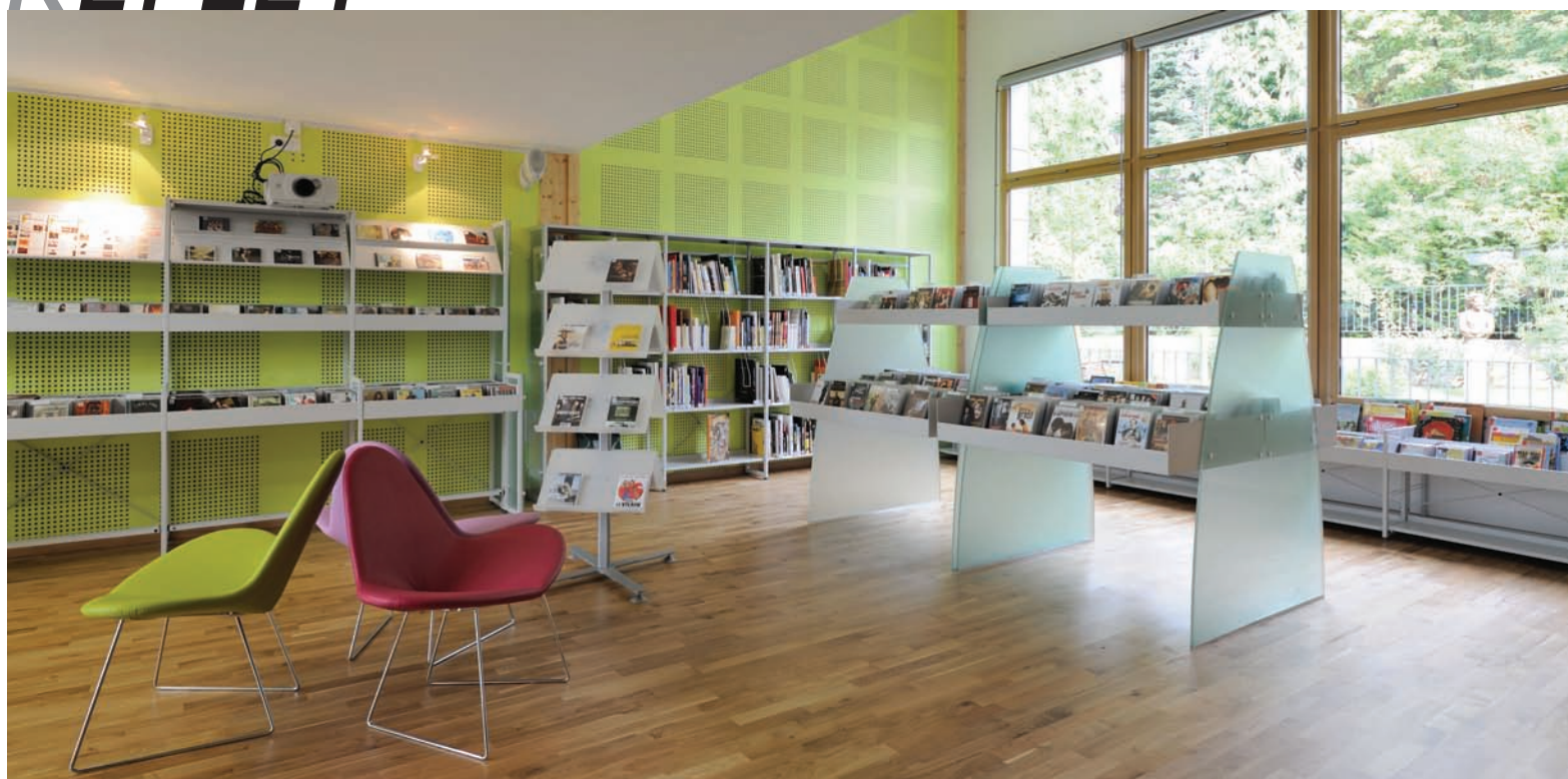
Médiathèque Jacqueline de Romilly de Crosne. Rayonnage Reflet, bac audio sur mesure avec parements en verre dépolis arondis. Jacqueline de Romilly media library in Crosne. Reflet shelving, made-to-measure audio tray with bevelled fine hackle glass sidings.