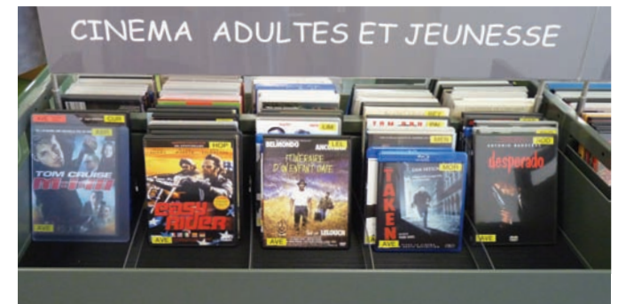
Bac DVD pour adultes, cuve grande capacité.