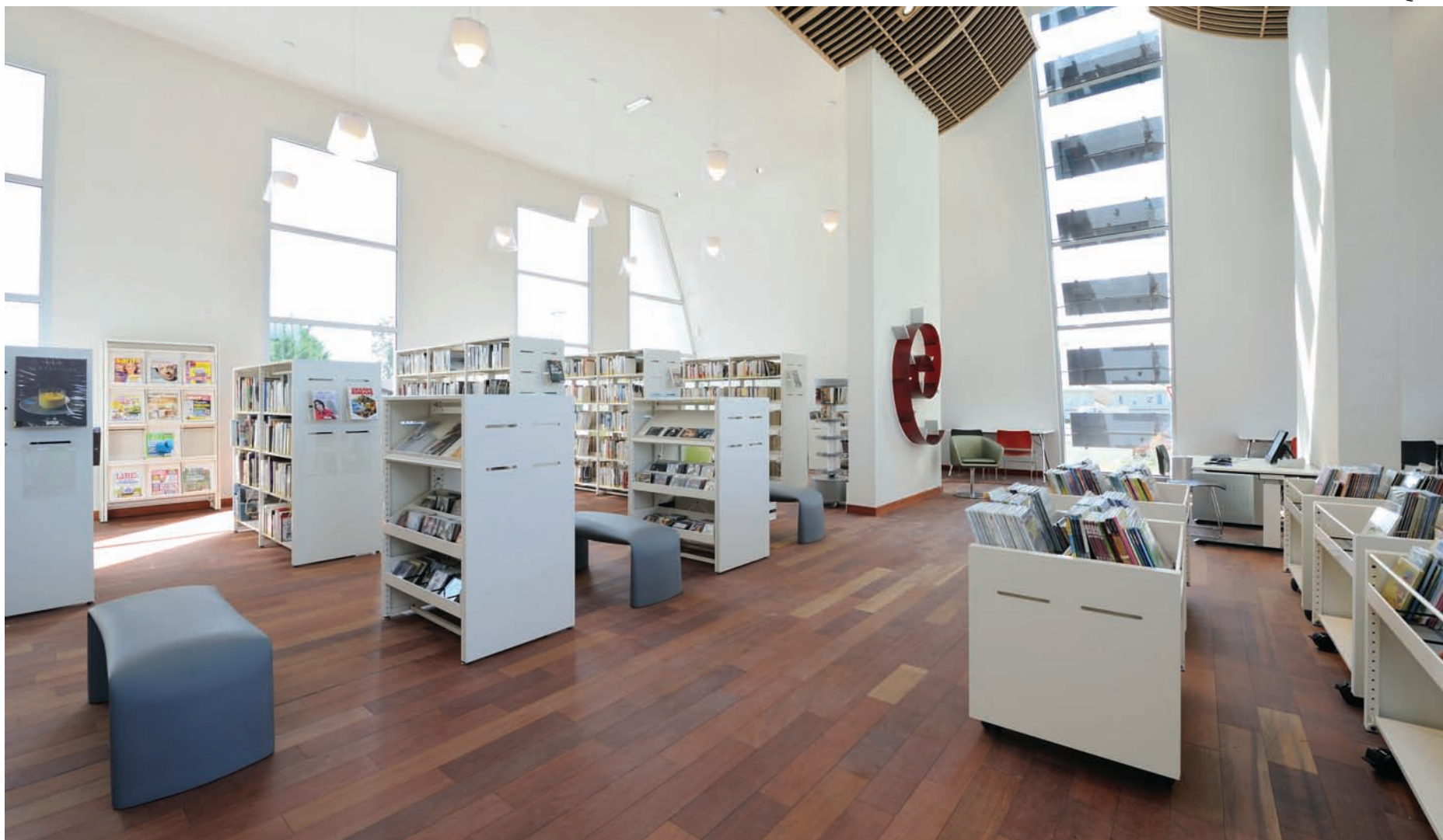
Bibliothèque municipale Le Passage D'Agen 47520. Parements en bois médium laqué blanc avec rainures . Municipal library, Le Passage D'Agen 47520. Lacquered medium white wood sidings with grooves.