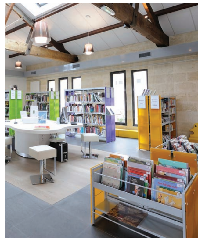
Parement en méthacrylate teinté, Kiwi, Orange, Plum. Orange, Plum tinted methacrylate siding.