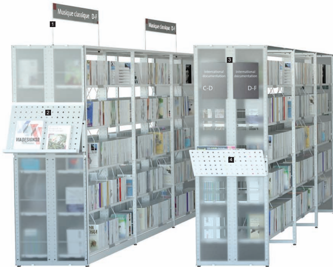
1 Signalétique supérieure/ Upper signage