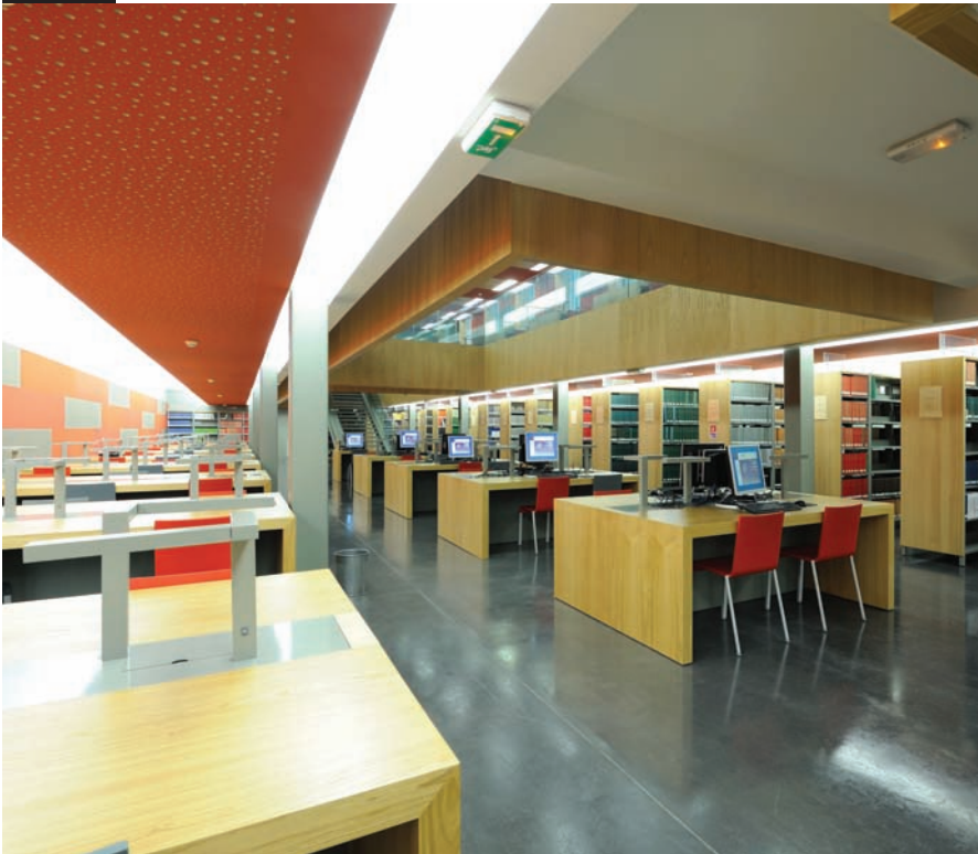
Bibliothèque Universitaire Pierre et Marie Curie, Paris 75252. Parements en bois, finition châtaignier. Pierre and Marie Curie University library, Paris, 75252. Wood sidings, chestnut finish.

■ Architecte/Architect Phine DOTTELONDE JM DESTINO Architecte délégué