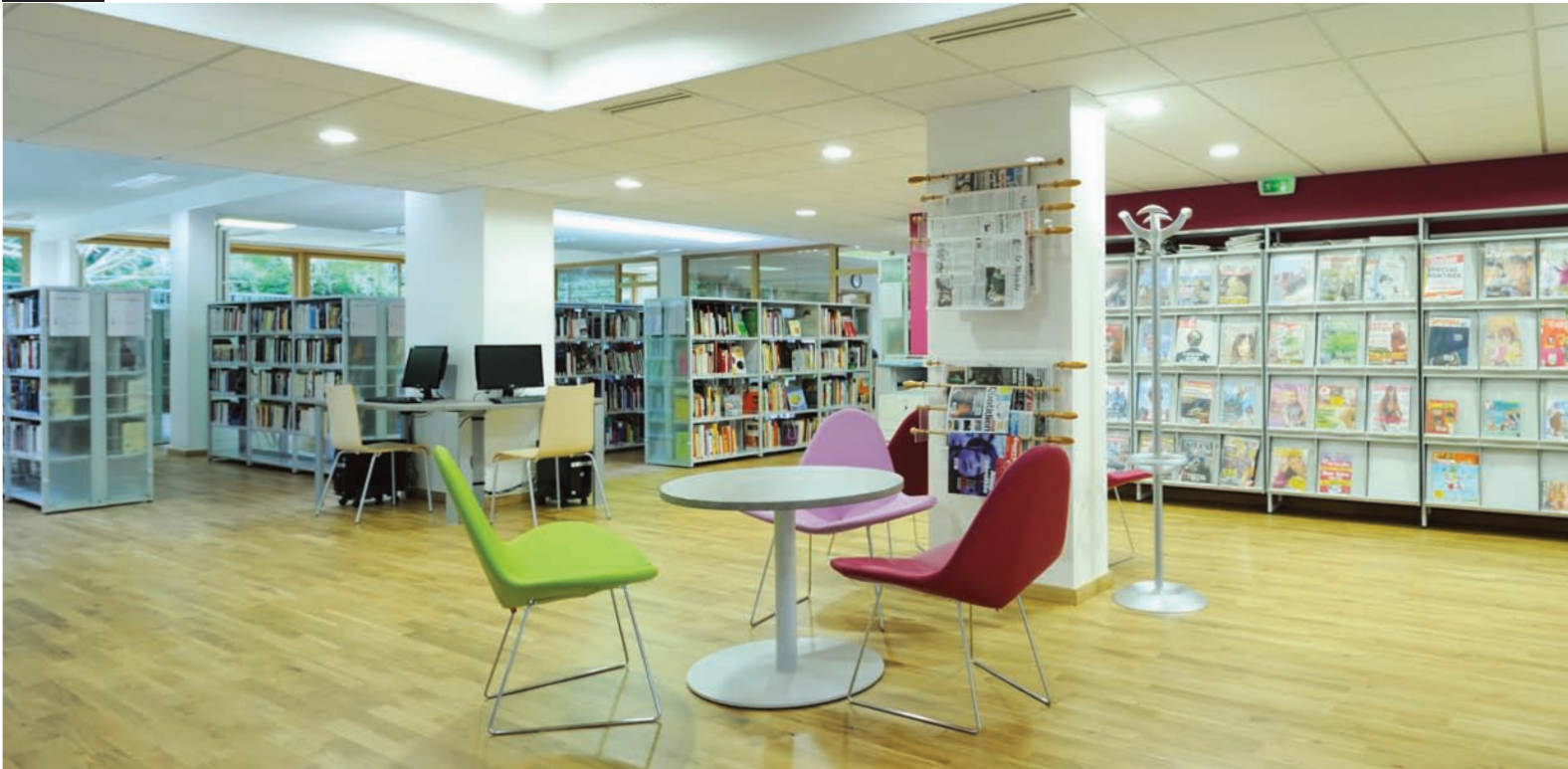
Bibliothèque Jacqueline de Romilly à Crosne 91560 parements en verre dépoli. Jacqueline de Romilly library in Crosne, 91560, fine hackle glass sidings.