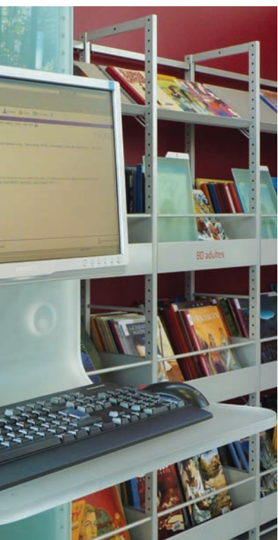
réglable en methacrylate satiné snow. stain-finished methacrylate work station.