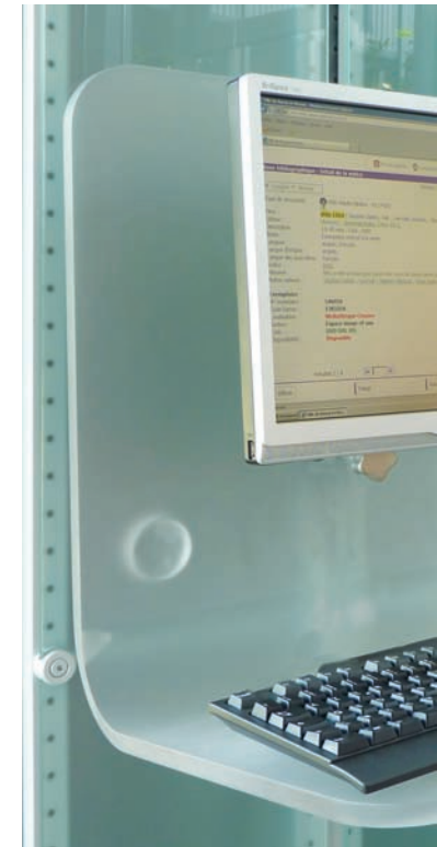
Poste de consultation ergonomique User-friendly, adjustable snow