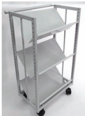
Chariot métallique Simple face 3 tablettes inclinées. Metal truck fitted with 3 slanted shelves.