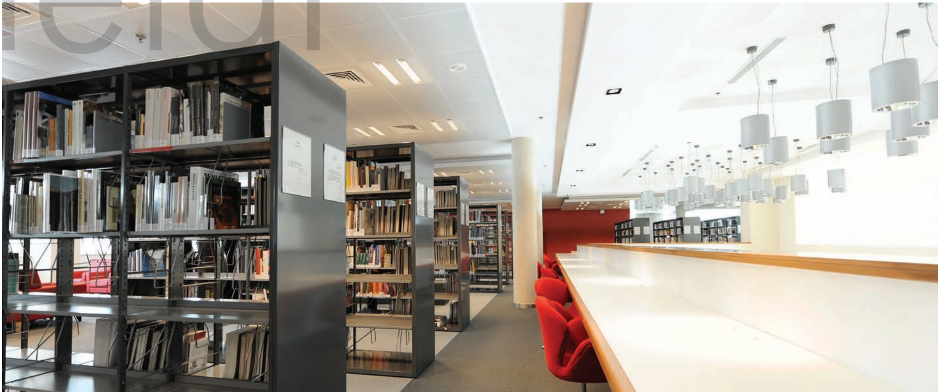
Bibliothèque Universitaire Paris Sorbonne à Abu Dhabi. Parements en métal peinture époxy. University library of Paris Sorbonne in Abu Dhabi. Grooved metal sidings with epoxy paint.