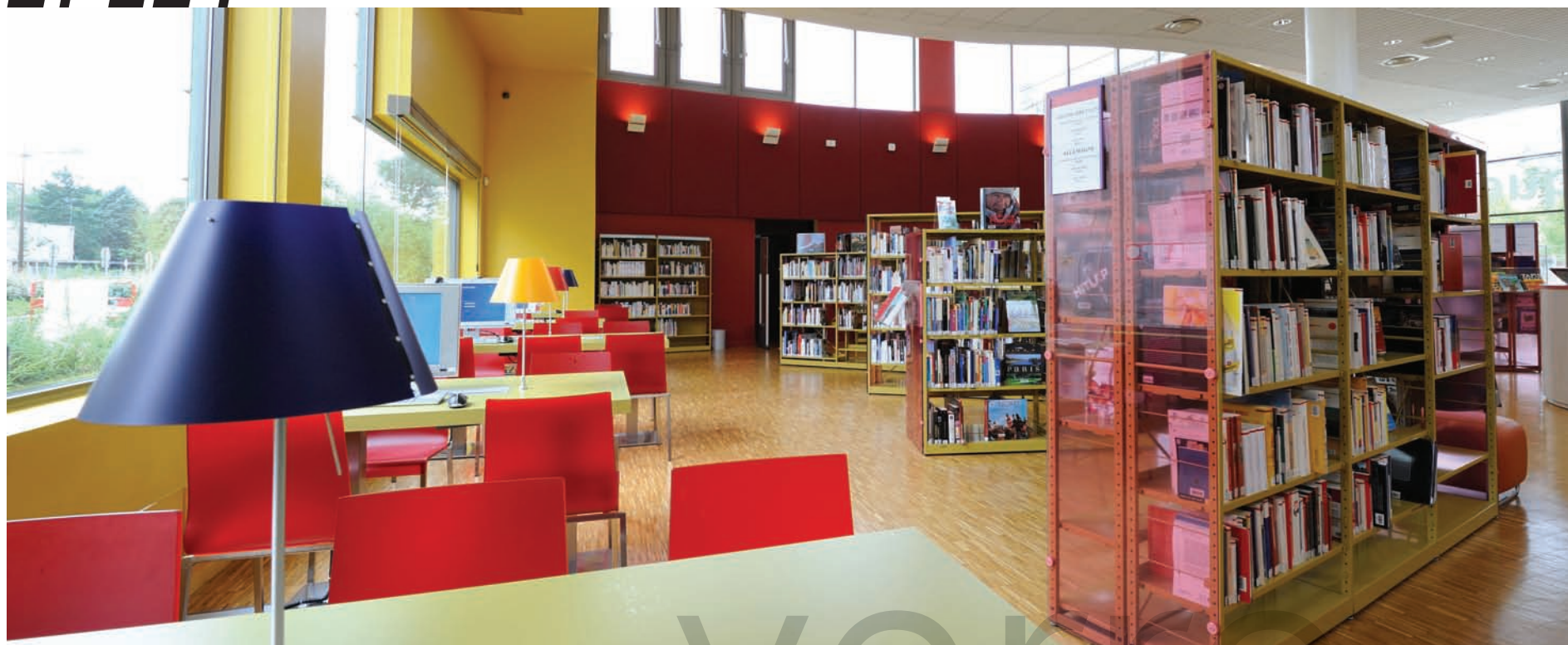
Médiathèque Orléans La Source 45000, Parements en verre avec film teinté translucide. Orléans Media Library, La Source 45000, Glass sidings with transparent tinted films.