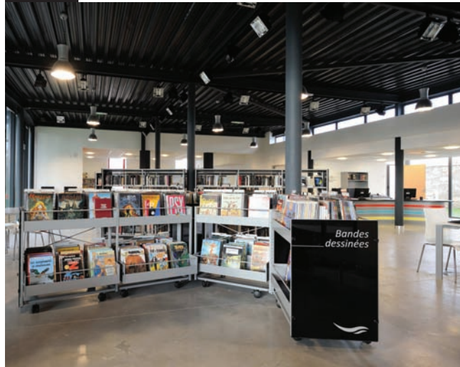
Bac BD pour adultes sur roulettes, habillage verre, 4 cuves BD grande capacité.