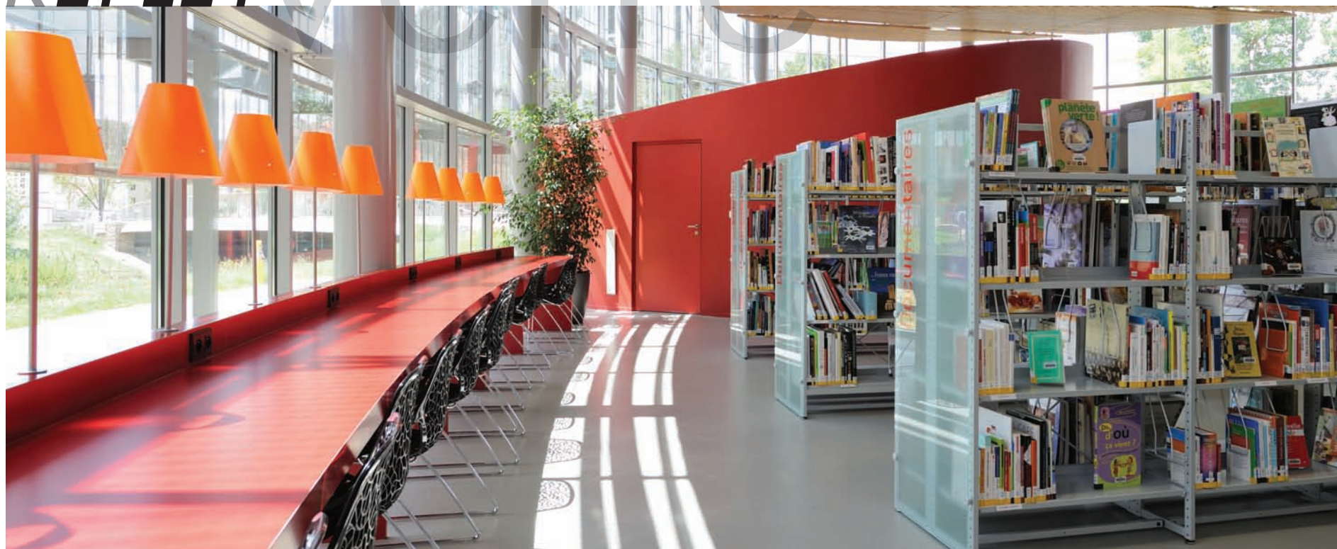
Médiathèque Aimé Césaire de Bourg en Bresse 01000. Parements en verre dépolis avec signalétique personnalisée. Aimé Césaire media library in Bourg-en-Bresse, 01000. Fine hackle glass sidings with personalised signage.