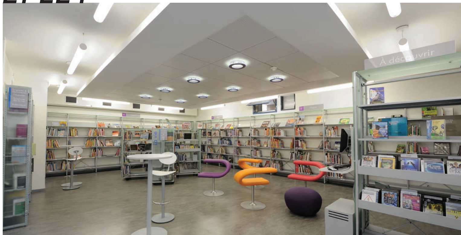
Médiathèque Till L'espègle de Villeneuve D'Ascq. Parements en verre dépoli. Till L'espègle media library, Villeneuve d'Ascq 59491.