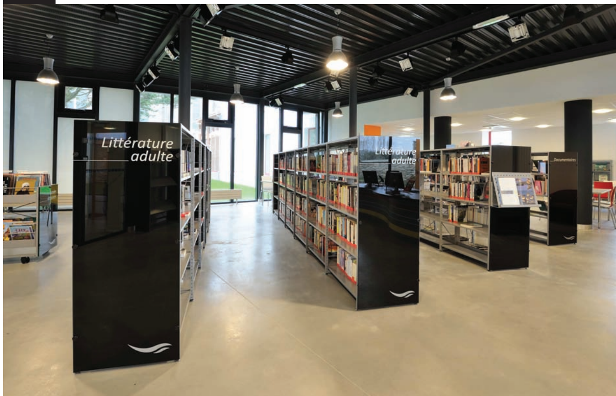
Médiathèque «Le Grand Lieu», La Chevrolière 44118, France. Parements en verre avec films et motifs découpés. "Le Grand Lieu" media library, La Chevrolière 44118, France. Glass sidings with cut out films and designs.