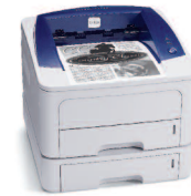
Phaser 3250 illustrée avec le Magasin 2 en option